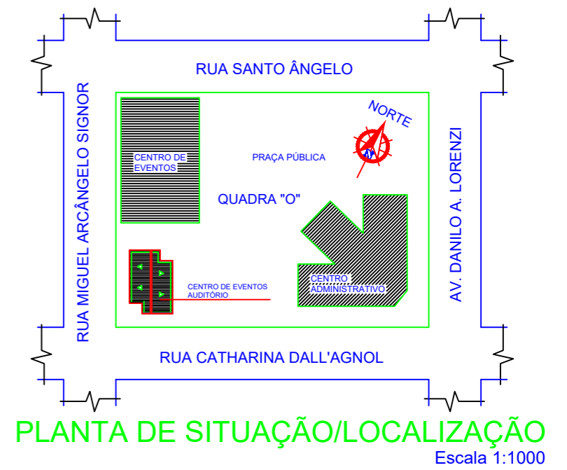
PLANTA DE SITUAÇÃO/LOCALIZAÇÃO Escala 1:1000